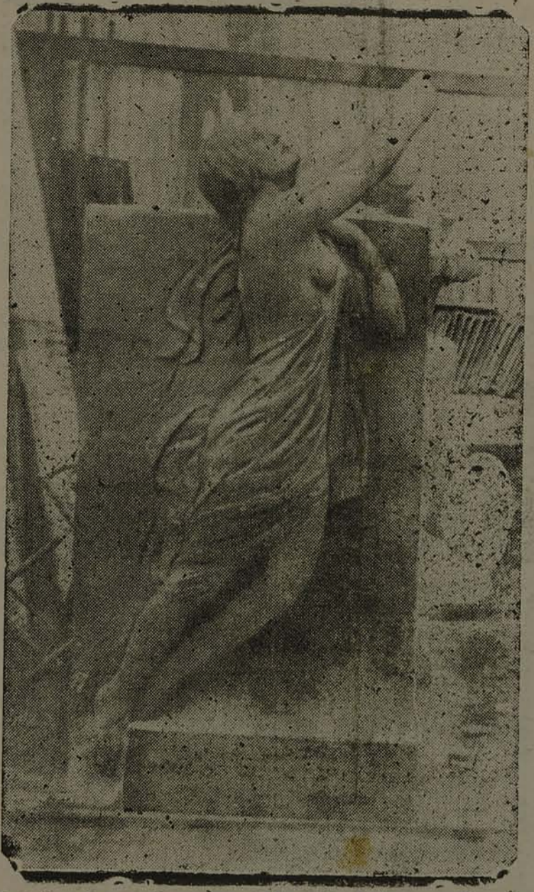
Detalhe do monumento a Hercílio Luz que deveria ser erigido nesta Capital

E Hercílio Luz, grande entre os maiores, pelo seu inconfundível amôr ao torrão natal, pelas suas realizações audaciosas na grandiosidade, pelo seu destemor nas lutas da democracia, deve ter o seu nome ligado, não apenas a uma praça da pequena vila de Biguassú, mas a todas as comemorações cívicas em memória de nossos mor-