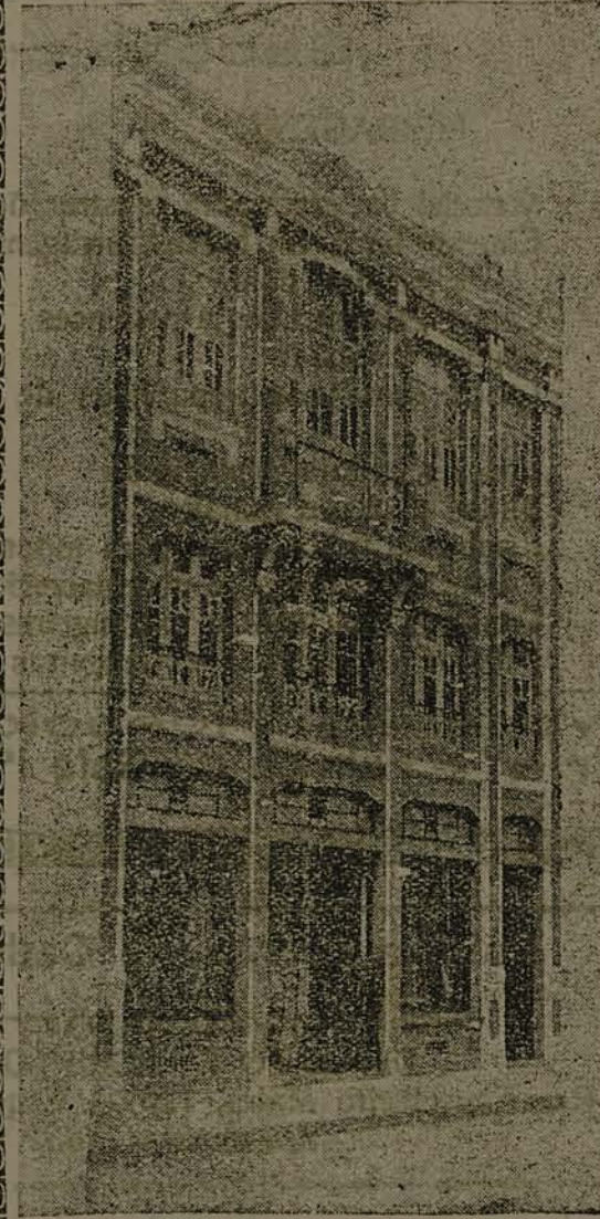
O magestoso prédio em que está instalada a casa comercial que é o orgulho do povo de FLORIANOPOLIS