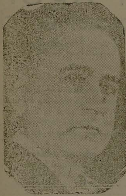
O sr. Getulio Vargas, presidente da Republica

Domingo último realizaram-se, na vizinha cidade de Biguassú, excepcionais comemorações, inaugurando-se, festivamente, os novos melhoramentos públicos: jardim da praça Nerêu Ramos e alameda Olivio Amorim, cuja construção se deve ao esforço e á capacidade empreendedora do sr. Alfredo Silva, digno e estimado prefeito daquela florescente edificação.