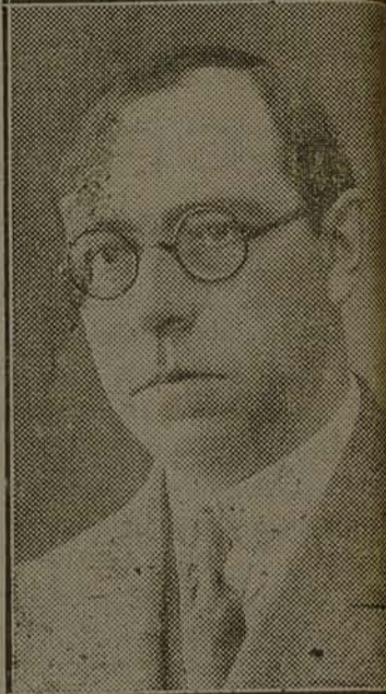
Dr. Nerêu Ramos, Presidente do Estado

Por último agradecendo as homenagens, falou o chefe do executivo estadual, dr. Nerêu Ramos, discursando sôbre a terra biguassuense, e terminou referindo-se aos