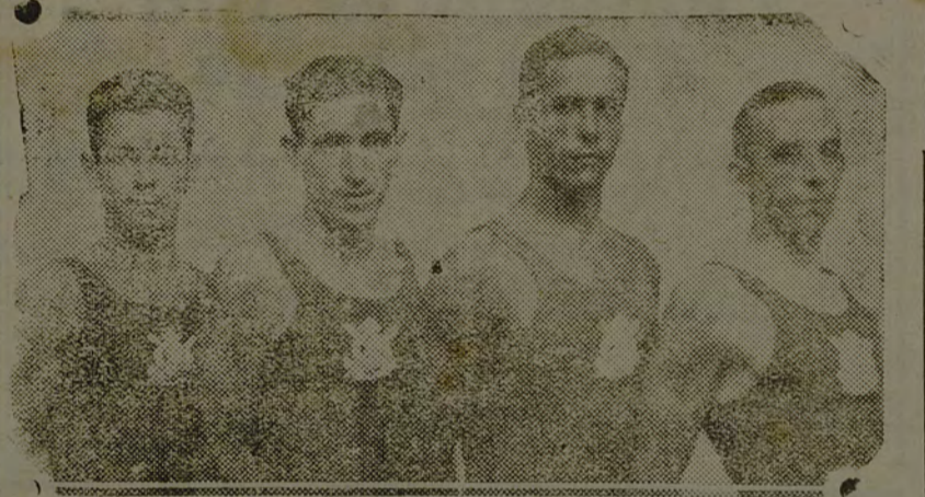
O "four" riachuelino que se tem mantido invicto em Santa Catharina

No pareo Honra a Liga correu tambem sozinho o Clube Nautico Riachuelo, com o seu valoroso four, o mesmo que representou o nosso Estado no ultimo Campeonato Brasileiro do Remo, e, que tem p. r. r. r. r. r. r.