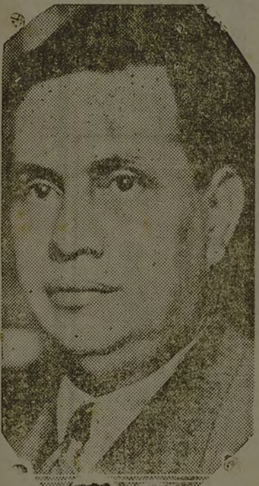
O ministro da Guerra Goés Monteiro, que está brigando com os seus granadeiros.

RIO, 8 (G)— Realizou-se ontem, ás 17 horas, a anunciada reunião no Clube Militar.