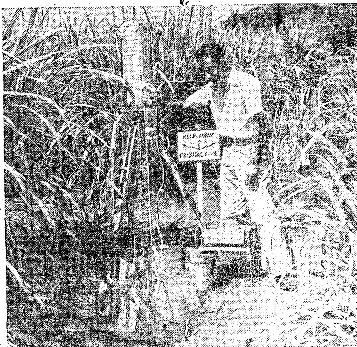
As pesquisas nucleares melhoraram os métodos de irrigação e alimentação das plantas no arquipélago de Havai, contribuindo decisivamente para a produção sem precedentes registrada no setor do açúcar nos últimos dois anos. Durante oito anos a Associação dos Produtos de Açúcar do Havai, em cooperação com a Comissão de Energia Atômica dos Estados Unidos, estudou todas as fases da cultura da cana de açúcar e sua moagem para melhorar o rendimento da indústria açucareira havaiana. Os resultados demonstram como a pesquisa nuclear cooperada pode aumentar a produção de alimentos em inúmeras áreas de mundo através de uma participação no programa de átomos para o bem da Humanidade.