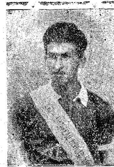
Dado uma das garantias da defesa da S.D. Vasto Verde