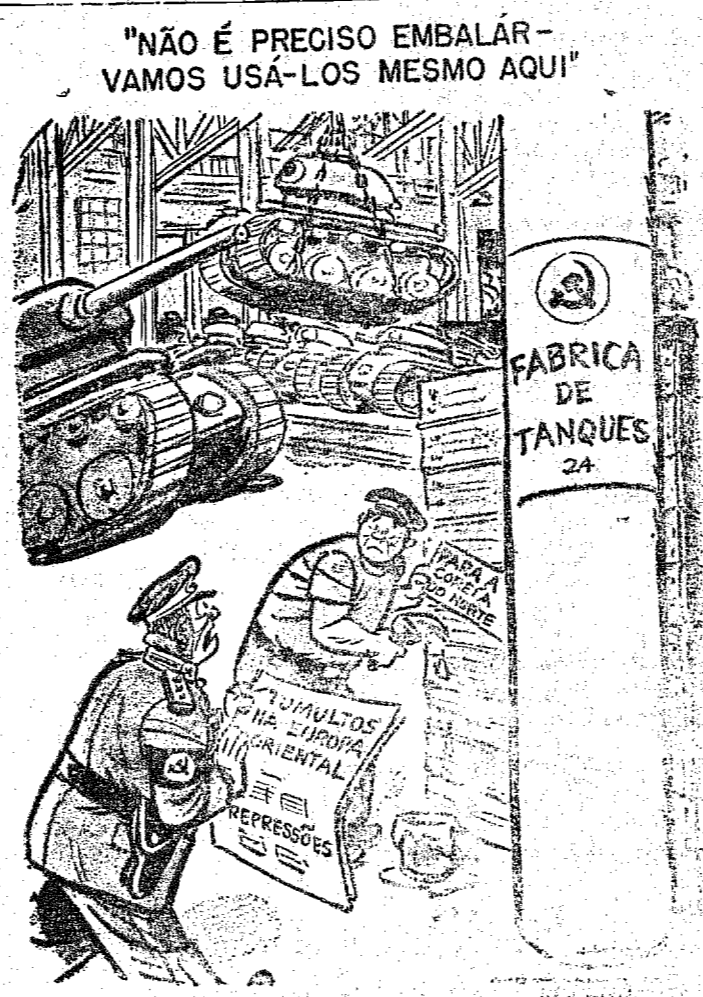
PUBLICADO NO DIÁRIO "THE WASH. HERALD POST", de WASHINGTON

também atacaram posições de artilharia em Taishan, onde, pela primeira vez, encontraram posante barragem de artilharia antiaerea comunista. Nos circulos informados de Taipei, salienta-se que não obstante a destruição, pela Marinha e Aviação nacionalista, de um importante comboio adversário, há dois dias — os comunistas conseguiram desembarcar pelo menos dois mil soldados na ilha.